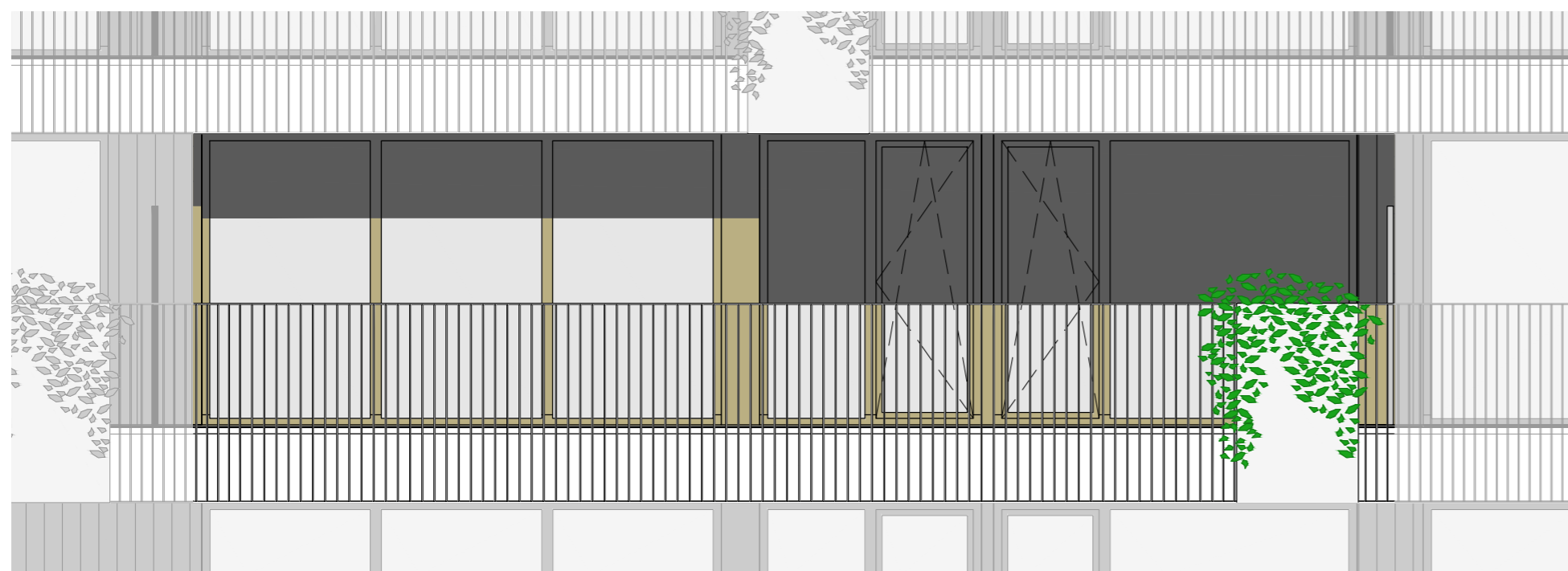
voorgevel appartement 6 (schaal 1:50)