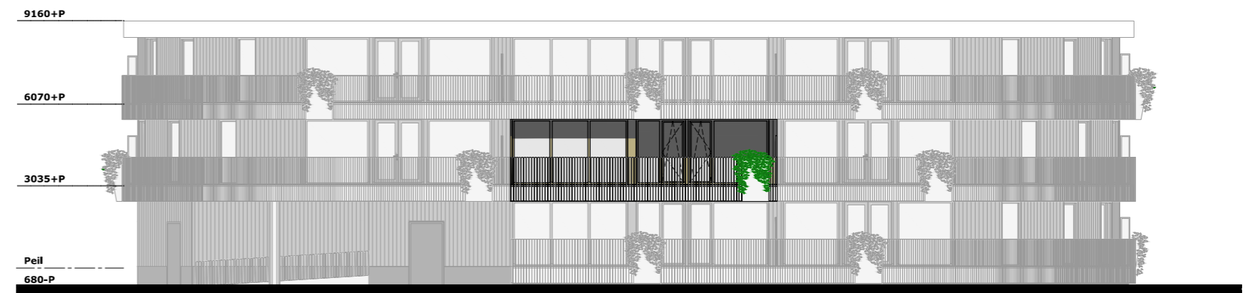
zuidgevel (schaal 1:200)